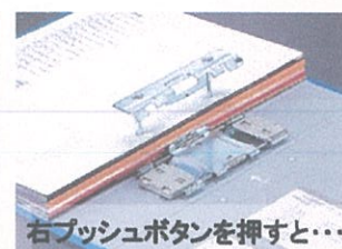
右プッシュボタンを押すと...